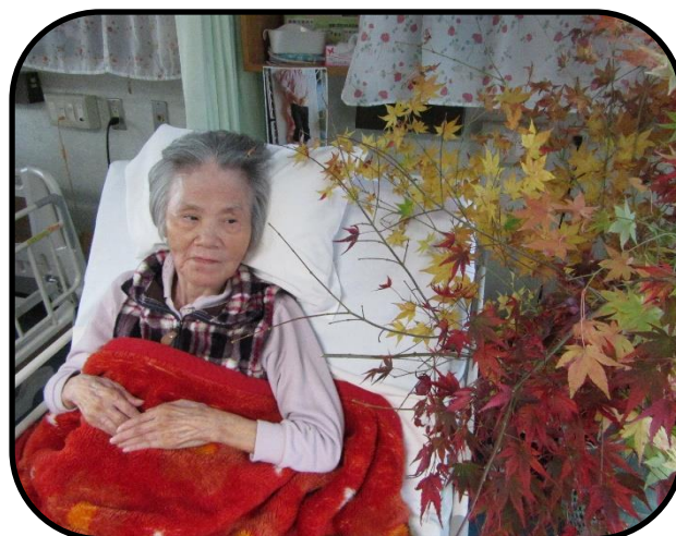
▲紅葉を食い入るように見つめられます