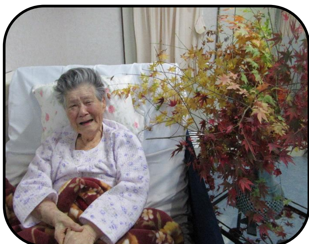
▲紅葉と笑顔で写真を撮られます