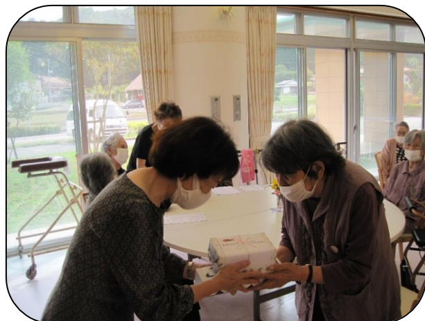
▲周美会より記念品贈呈