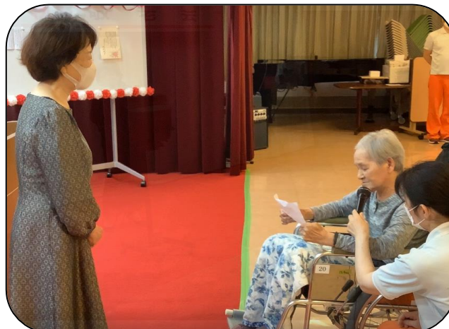
▲利用者さん代表挨拶