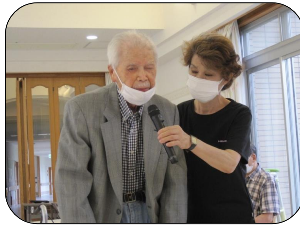
▲利用者さん代表挨拶