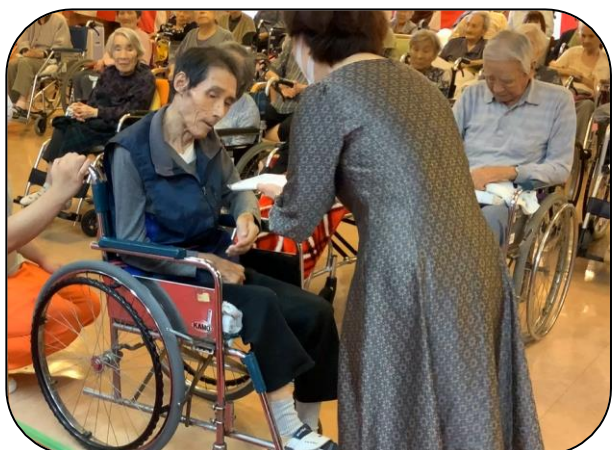
▲周美会より記念品贈呈

9月24日、ご家族をお招きしての敬老会は実施出来ませんでした。利用者さんと職員で皆さんの長寿をお祝いしました。特養では、3名の利用者さんが100歳をお迎えになり、内閣総理大臣の、お祝いの記念品が贈呈されました。