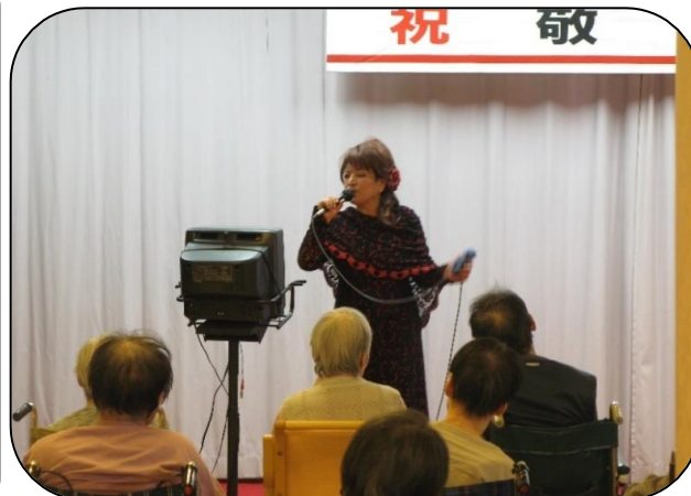
▲「珍島物語」他、4曲熱唱

式典後のアトラクションでは職員による歌謡ショーを行いました。職員の歌声をじっと聞き入っておられる方や、一緒に口ずさまれる利用者さんもいらっしゃいました。最後に利用者さんの代表者が「このような式典を開催して下さりありがとうございました」と挨拶をされ、式典は盛大に終わりました。