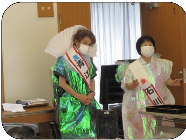
▲「津軽海峡冬景色」他2曲披露