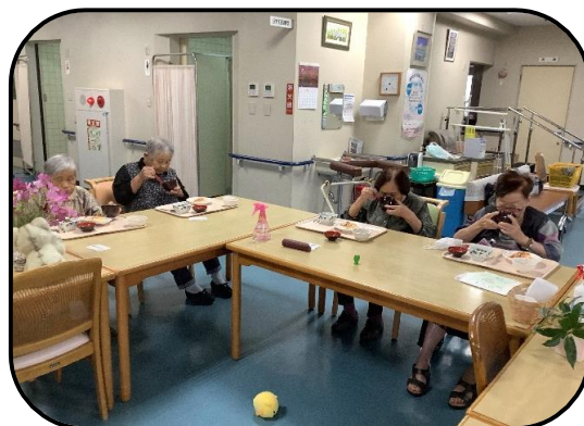
▲ 間引いた葉を味噌汁に入れて召し上がりました